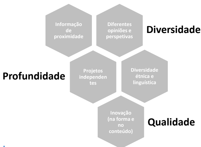
Figura 3. Princípios e valores da função social e política do jornalismo

- projetos jornalísticos independentes (através de fundos de financiamento que estabelecem mecanismos de apoio direto à concretização de oferta alternativa).