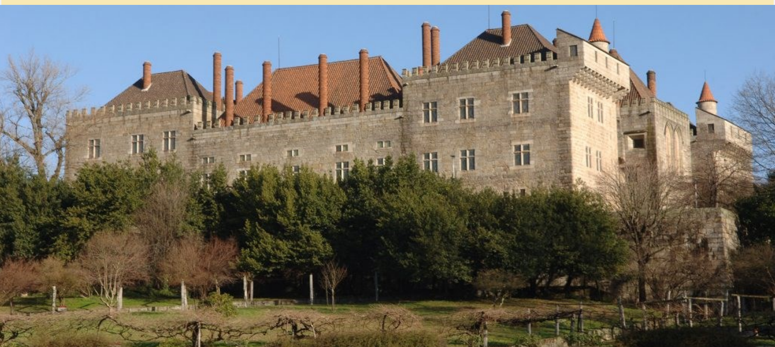
Paço dos Duques / Câmara Municipal de Guimarães